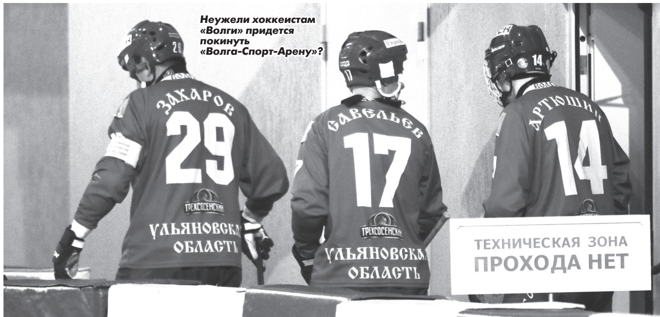
Неужели хоккеистам «Волги» придется покинуть «Волга-Спорт-Арену»?

ХК «ВОЛГА» может остаться без большого льда в предсезонный период.