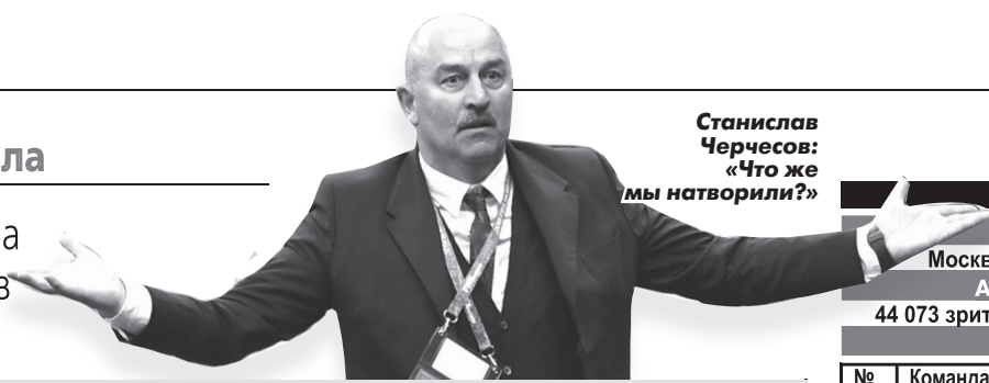
Станислав Черчесов: «Что же мы натворили?»

Сборная России сенсационно выбила из борьбы за Кубок мира чемпионов мира 2010 года - команду Испании.