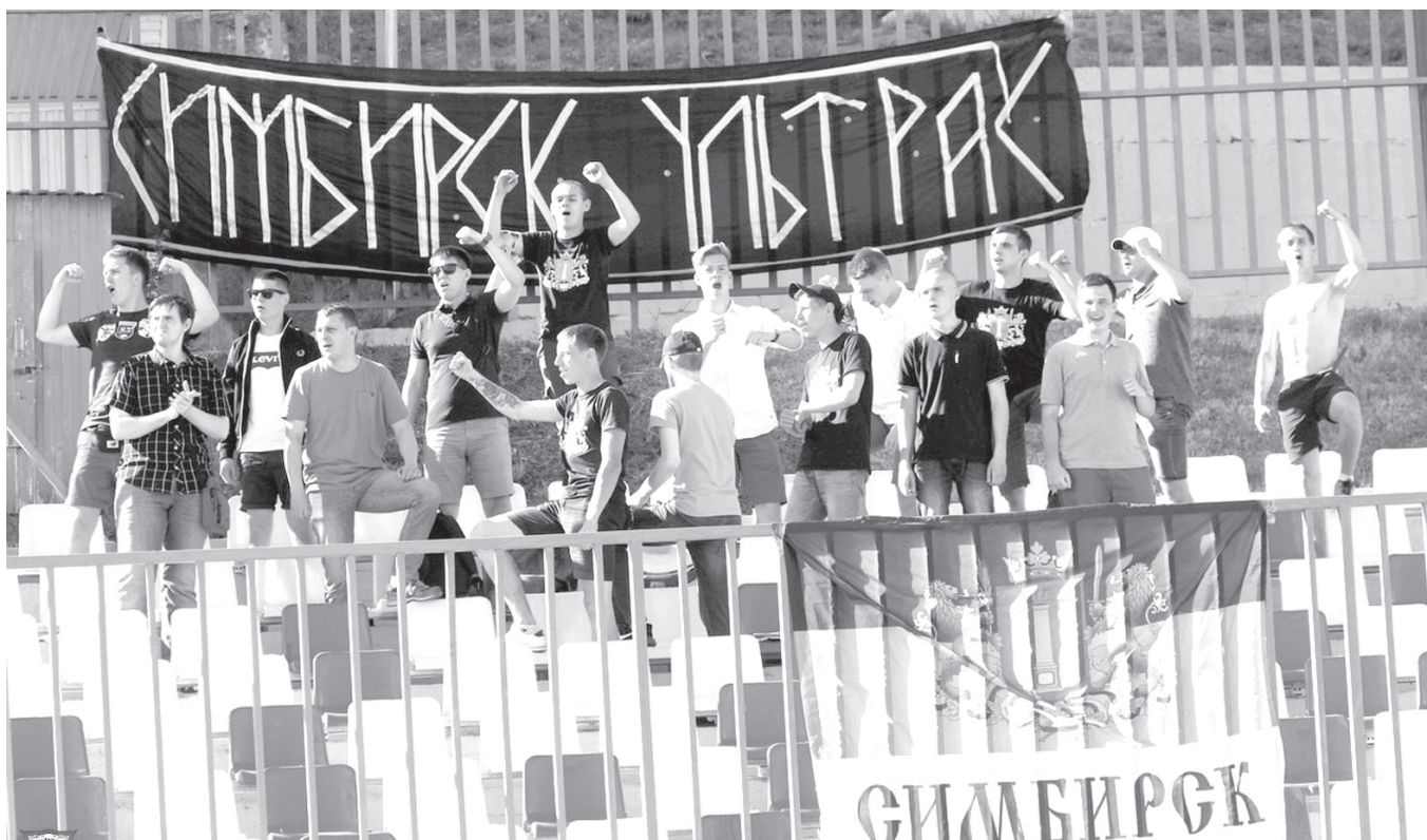
Фанаты «Волги» уже облюбовали сектор обновленного стадиона «Труд».

Напомним: ближайшим матчем «Лады» в первенстве МФС «Приволжье» станет домашняя игра с пензенским «Зенитом», которая состоится 11 июля. В этот же день «СШОР-Волга-М» также на своем поле примет «Крылья Советов-ЦПФ».