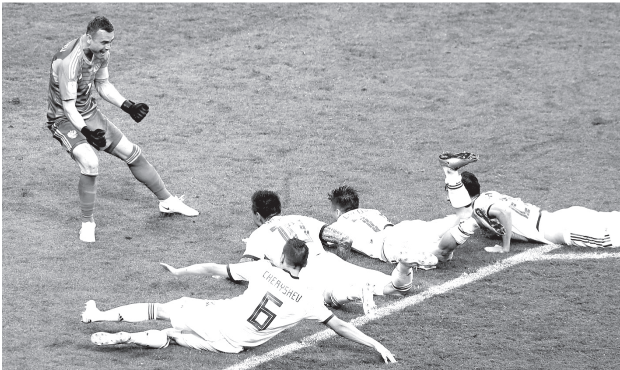
Ликует сборная России, ликует вся страна!

Россия этого результата добилась, и теперь всем нам хочется продолжения этой сказки. На очереди - Хорватия, одна из самых мобильных и играющих команд ЧМ-2018. Не хочется делать никаких прогнозов, просто скрепим пальцы на удачу!